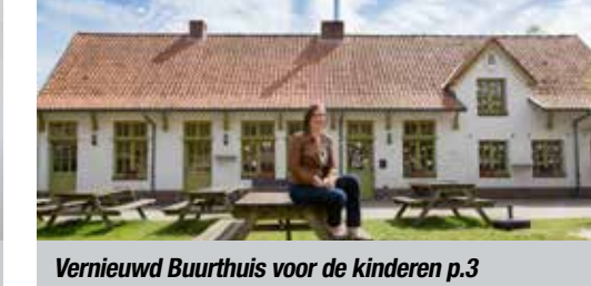
Vernieuwd Buurthuis voor de kinderen p.3