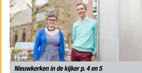
Nieuwkerken in de kijker p. 4 en 5