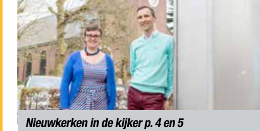
Nieuwkerken in de kijker p. 4 en 5

De informatie die op dit document wordt vermeld is bestemd voor het interne gebruik van de diverse diensten van de N-VA. De wet van 8 december 1992 in verband met de bescherming van de persoonlijke levenssfeer ten opzichte van de gegevensverwerking voorziet toegangsrecht tot de gegevens, het verbeteren of verwijderen ervan.