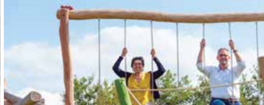
Opening speeltuin Mierennest in Belsele (p.3)