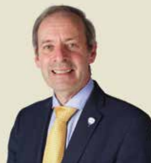
Burgemeester Lieven Dehandschutter

“We hebben de aanpalende school en de inwoners van de omliggende straten direct geïnformeerd en hen de nodige voorzorgsmaatregelen meegedeeld”, aldus burgemeester Dehandschutter. Het stadsbestuur liet in de omgeving ook bijkomende grondwaterstalen nemen. Daarnaast zal de Vlaamse overheid de vroegere fabrieksterreinen in de binnenstad onderzoeken, aangezien zij destijds PFOS en aanverwante stoffen in de textielproductie gebruikten.