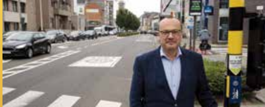
Verhoogde verkeersveiligheid in Sint-Niklaas (p.2)