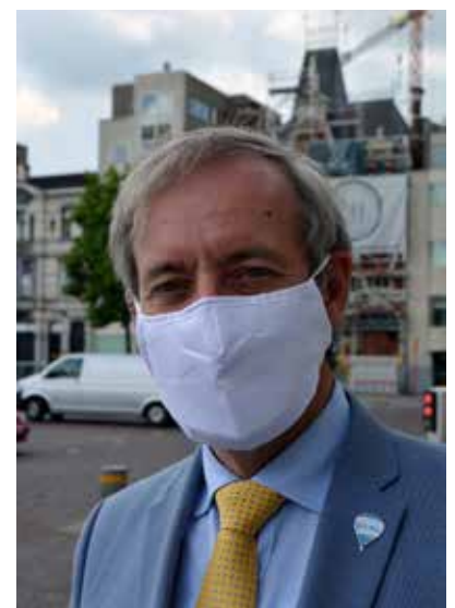
Lieven Dehandschutter Burgemeester

Het overgrote deel van onze bevolking geeft blijk van burgerzin en solidariteit. Daarvoor wil ik alle inwoners feliciteren. Er is echter ook een kleine minderheid die bewust in de fout gaat, met het sluikestorten als meest ergerlijke uitwas. Dat is onduelbaar. Tot slot roep ik onze inwoners op om de veiligheidsmaatregelen te blijven respecteren. Er staan immers levens op het spel.