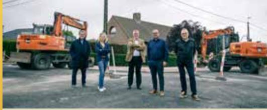
Openbare werken in een stroomversnelling (p.2)