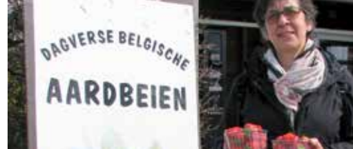
Lentemarkt opent wervelend toeristisch seizoen p. 3