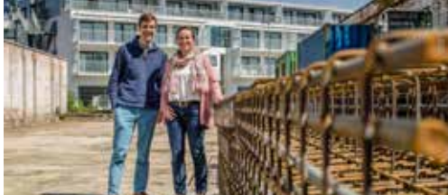
SNMH bouwt 12 appartementen p. 2