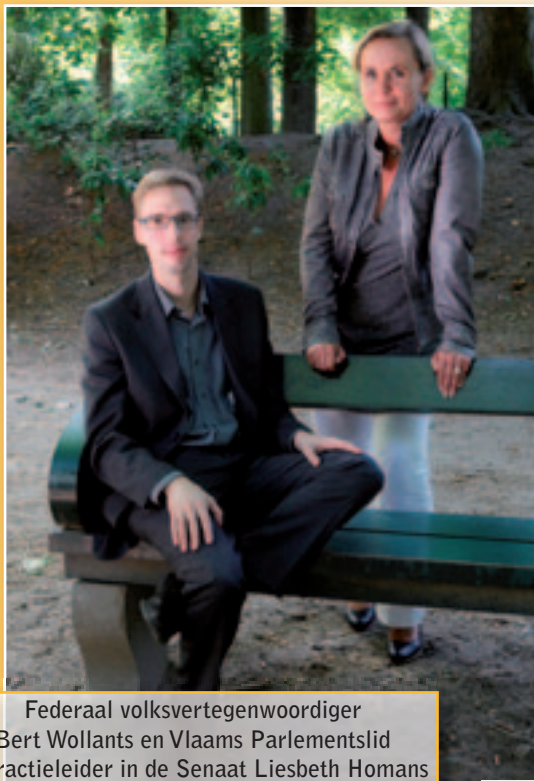
Federaal volksvertegenwoordiger Bert Wollants en Vlaams Parlementslid en fractieleider in de Senaat Liesbeth Homans zijn de N-VA-specialisten op het vlak van energie.

Uw energiefactuur swingt de pan uit. De toekomstige energiebevoorrading moet verzekerd blijven. En het is in Vlaanderen weinig realistisch om alle energie voor 100 % uit hernieuwbare bronnen te halen. Daarom ontwikkelde de N-VA een evenwichtige totaalvisie op energie.